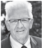
Winfried Kretschmann DIE GRÜNEN

Sinnvoller und zielführender als starre prozentuale Vorgaben für den Erhalt der Biodiversität erscheint uns eine konsequente Weiterentwicklung und Umsetzung der Konzepte der naturgemäßen Waldwirtschaft, in die Alt- und Totholzprogramme integriert werden. Einen wichtigen Beitrag leisten dazu weiter die Kernzonen des Nationalparks und der Biosphärengebiete.