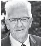
Winfried Kretschmann DIE GRÜNEN

Wir stehen zu unserer Verantwortung für den Ausstieg aus der Kernenergie und zur bundesweiten ergebnisoffenen Suche nach einem Endlager. Dabei gilt es aber die berechtigten Interessen unserer betroffenen Standorte und Unternehmen aktiv im Bund und gegenüber anderen Bundesländern wahrzunehmen. Alle bisherigen Untersuchungen lassen nur den Schluss zu, dass es in Baden-Württemberg keine geeigneten Gesteinsschichten für ein solches Endlager gibt. Vorausseilende Blankozusagen in Fragen der Zwischenlagerung wird es mit uns nicht geben.