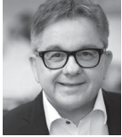
Guido Wolf CDU

Wir stehen zu unserer Verantwortung für den Ausstieg aus der Kernenergie und zur bundesweiten ergebnisoffenen Suche nach einem Endlager. Dabei gilt es aber die berechtigten Interessen unserer betroffenen Standorte und Unternehmen aktiv im Bund und gegenüber anderen Bundesländern wahrzunehmen. Alle bisherigen Untersuchungen lassen nur den Schluss zu, dass es in Baden-Württemberg keine geeigneten Gesteinsschichten für ein solches Endlager gibt. Vorausseilende Blankozusagen in Fragen der Zwischenlagerung wird es mit uns nicht geben.