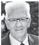
Winfried Kretschmann DIE GRÜNEN

Der Klimawandel ist eine der großen Herausforderungen, denen wir gegenüberstehen. Es bedarf hier zwingend einer international abgestimmten Vorgehensweise. Die wesentlichen klimapolitischen und energiepolitischen Rahmenbedingungen werden immer stärker auf europäischer und nationaler Ebene festgelegt. Baden-Württemberg kann aber vor allem durch eigene Förderprogramme, durch Kooperationen mit Kommunen, Bürgern, Verbänden und der Wirtschaft, durch Beratungs- und Informationsangebote, durch Bildungsprojekte und durch eine gezielte Forschungsförderung seinen Beitrag leisten. Wir stehen deswegen zum Klimaschutzgesetz des Landes. Die vielfältigen am Landtag vorbei beschlossenen Maßnahmen zu seiner konkreten Umsetzung im Energie- und Klimaschutzkonzept bedürfen aber der Überprüfung und teilweise auch der Revision.