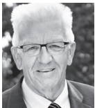
Winfried Kretschmann DIE GRÜNEN

Das Ziel unserer Politik ist eine Landwirtschaft, die wirtschaftlich arbeitet, die aber gleichzeitig umweltfreundlich ist, dabei Tier- und Naturschutz beachtet und weiter entwickelt. Das sehen wir als Grundsatz und Aufgabe für die konventionelle wie für die ökologische Wirtschaftsweise gleichermaßen. Der ökologische Landbau leistet bereits heute einen wichtigen Beitrag und sein Potential sollte im Rahmen der wirtschaftlichen Gegebenheiten weiter ausgebaut werden. Um dieses Ziel zu erreichen, bedarf es einer übergreifenden Strategie, die aktuell auf Bundesebene durch das Bundesministerium für Ernährung und Landwirtschaft erarbeitet wird und die Ende 2016 vorliegen soll. Bei der Förderung und weiteren Stärkung des ökologischen Landbaus schreibt die CDU den lokalen Vermarktungsstrukturen von heimisch produzierten Lebensmitteln eine wichtige Bedeutung zu. [...]