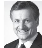
Hans-Ulrich Rülke FDP

Das IEKK, das verstärkte Förderprogramm der L-Bank für energetische Sanierungen und deutlich mehr Mittel für die Sanierung landeseigener Liegenschaften waren die Kernpunkte unserer erfolgreichen Energiepolitik. Wir wollen v.a. die Windkraftnutzung und Photovoltaik massiv weiter ausbauen. Beim Ausbau der Windkraft ist in 2015 endlich ein starker Anstieg im Land zu verzeichnen. Grün-Rot stellt eigene Flächen, v.a. im Wald, zur Verfügung. Den Ausbau der Photovoltaik befördert das Land durch eigene Investitionen und Bereitstellung von Flächen. Zudem setzen wir uns auf Bundesebene für einen besser geförderten Ausbau von Freiflächenanlagen ein. Die Weiterentwicklung der Speicherung wie auch der Ausbau der Höchstspannungsleitungen sind im besonderen Interesse unseres Landes. Zu beidem stehen wir.