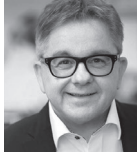
Guido Wolf CDU

Der Klimawandel ist eine der großen Herausforderungen, denen wir gegenüberstehen. Es bedarf hier zwingend einer international abgestimmten Vorgehensweise. Die wesentlichen klimapolitischen und energiepolitischen Rahmenbedingungen werden immer stärker auf europäischer und nationaler Ebene festgelegt. Baden-Württemberg kann aber vor allem durch eigene Förderprogramme, durch Kooperationen mit Kommunen, Bürgern, Verbänden und der Wirtschaft, durch Beratungs- und Informationsangebote, durch Bildungsprojekte und durch eine gezielte Forschungsförderung seinen Beitrag leisten. Wir stehen deswegen zum Klimaschutzgesetz des Landes. Die vielfältigen am Landtag vorbei beschlossenen Maßnahmen zu seiner konkreten Umsetzung im Energie- und Klimaschutzkonzept bedürfen aber der Überprüfung und teilweise auch der Revision.