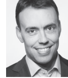
Nils Schmid SPD

Mit einem Klimaschutzgesetz und dem dazugehörigen Integrierten Energie und Klimaschutzkonzept (IEKK) wurden klare Ziele und konkrete Maßnahmen festgelegt. Die Haushaltsmittel dafür wurden durch SPD-Finanz- und Wirtschaftsminister Nils Schmid mehr als verdoppelt. Das Erneuerbare-Wärme-Gesetz wird den Klimaschutz im Gebäudesektor voranbringen. Die energetische Sanierung der landeseigenen Liegenschaften wurde beschleunigt, die Mittel dafür verdreifacht. Zudem wurden die gesetzlichen Weichen umgestellt und der Windenergieausbau endlich möglich gemacht. Über 250 Anlagen sind im Genehmigungsverfahren, über 120 bereits im Bau. Auch unsere Moorschutzkonzeption dient der Erreichung der Klimaschutzziele, da intakte Moore CO 2 -Senker sind, aber stark emittieren, wenn sie landwirtschaftlich genutzt werden.